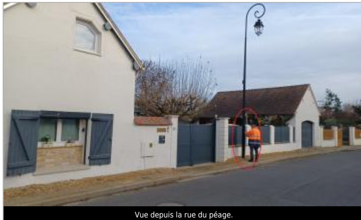
Vue depuis la rue du péage.