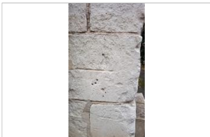
2025_Vue du repère_date inconnue

SOURCE DE REPÉRAGE : RECENSEMENT PAR LE SPC MLA - 06/02/2024