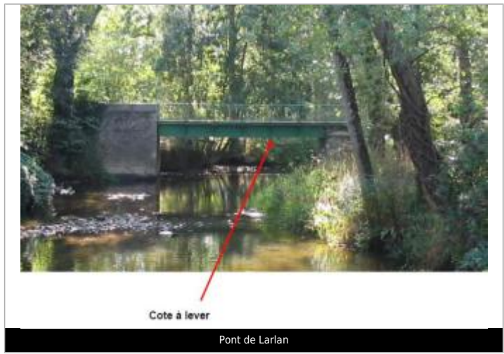
Cote à lever

MARQUE Maximum de l'inondation : Oui Visibilité : Non État du repère : Non renseigné Pérennité : Non renseigné