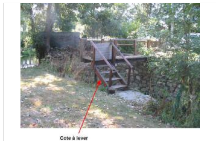
Cote à lever

MARQUE Maximum de l'inondation : Oui Visibilité : Non État du repère : Non renseigné Pérennité : Non renseigné