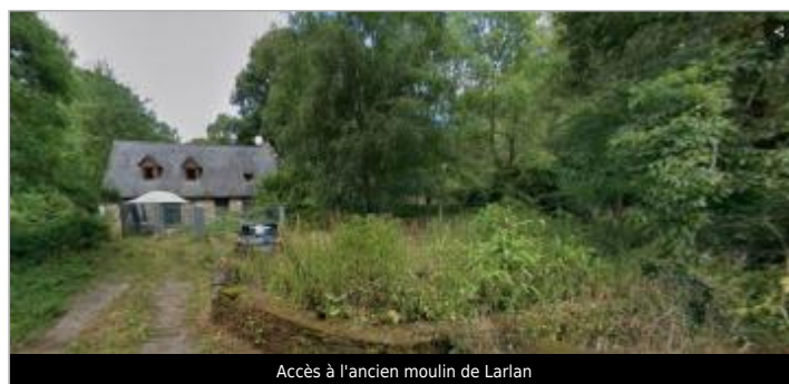
Accès à l'ancien moulin de Larlan

GÉOLOCALISATION Coordonnées WGS84 : X: -2.81016755 / Y: 48.14662710 Coordonnées RGF93 (Lambert 93) X: 268268.88 / Y: 6798808.84 Coordonnées RGF93 (ETRS89) : X: -2.8101676 / Y: 48.1466271 Code Hydro: J8--0230 Rive de référence: