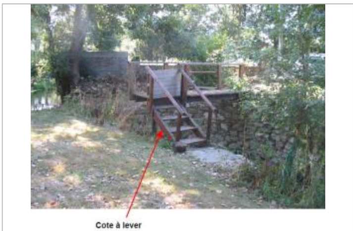
Pont proche de la roue du moulin de Larlan

MARQUE Maximum de l'inondation : Oui Visibilité : Non État du repère : Non renseigné Pérennité : Non renseigné