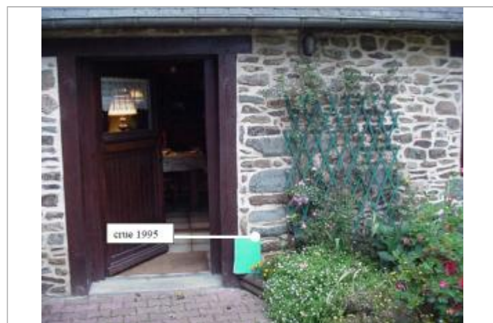
Porte de l'ancien moulin de Larlan

MARQUE Maximum de l'inondation : Oui Visibilité : Non État du repère : Non renseigné Pérennité : Non renseigné