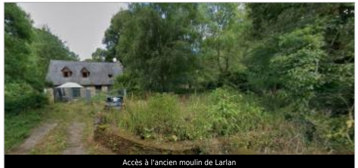
Accès à l'ancien moulin de Larlan

GÉOLOCALISATION Coordonnées WGS84 : X: -2.81016755 / Y: 48.14662710 Coordonnées RGF93 (Lambert 93) X: 268268.88 / Y: 6798808.84 Coordonnées RGF93 (ETRS89) : X: -2.8101676 / Y: 48.1466271 Code Hydro: J8--0230 Rive de référence: