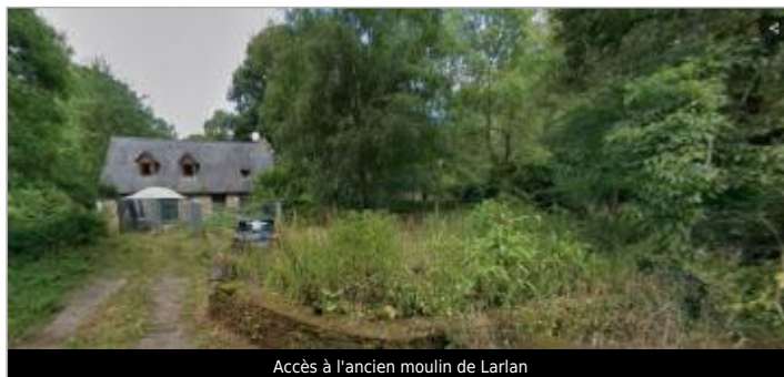
Accès à l'ancien moulin de Larlan