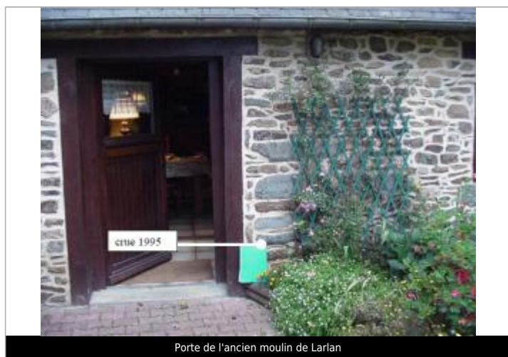
Porte de l'ancien moulin de Larlan

Type de repérage : Campagne de terrain post-inondation