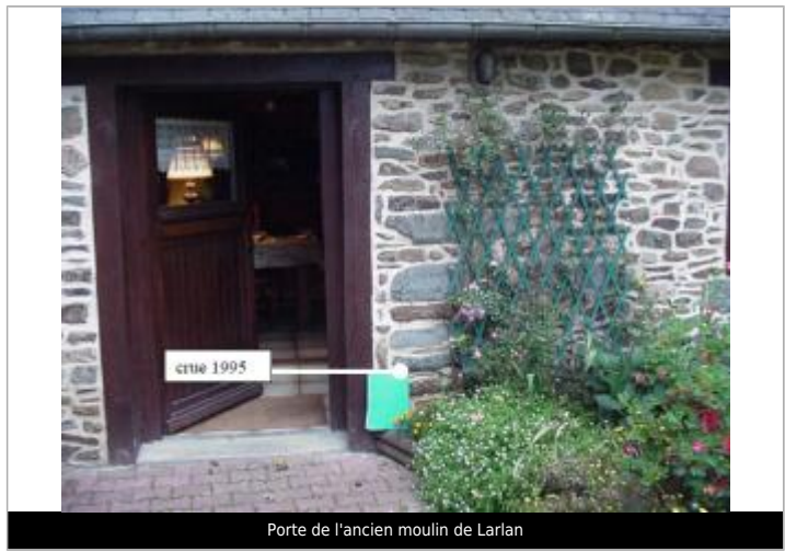
Porte de l'ancien moulin de Larlan

MARQUE Maximum de l'inondation : Oui Visibilité : Non État du repère : Non renseigné Pérennité : Non renseigné