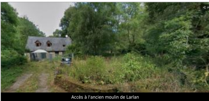
Accès à l'ancien moulin de Larlan

GÉOLOCALISATION Coordonnées WGS84 : X: -2.81016755 / Y: 48.14662710 Coordonnées RGF93 (Lambert 93) X: 268268.88 / Y: 6798808.84 Coordonnées RGF93 (ETRS89) : X: -2.8101676 / Y: 48.1466271 Code Hydro: J8--0230 Rive de référence: