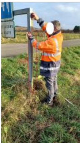
Laisse de crue à 142 cm/sol.

Altitude de la référence (en m) : 93.360 m