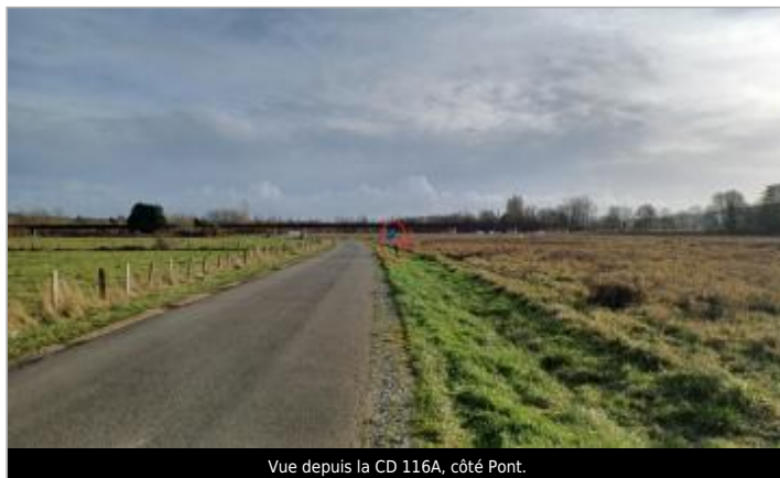
Vue depuis la CD 116A, côté Pont.

Coordonnées WGS84 : X: 1.54441856 / Y: 48.64429340