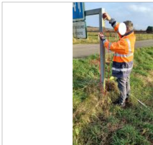
Laisse de crue à 142 cm/sol.

Altitude de la référence (en m) : 93.360 m