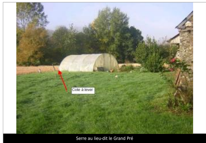
Serre au lieu-dit le Grand Pré