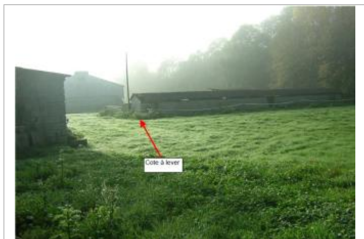
Repère au bâtiment agricole

Type de repérage : Campagne de terrain post-inondation