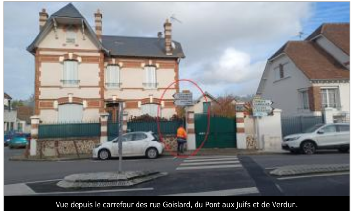
Vue depuis le carrefour des rue Goislard, du Pont aux Juifs et de Verdun.

Coordonnées WGS84 : X: 1.53682192 / Y: 48.64798430