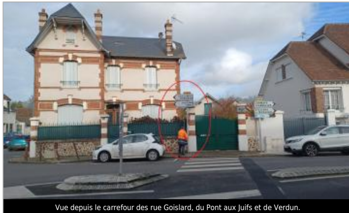
Vue depuis le carrefour des rue Goislard, du Pont aux Juifs et de Verdun.