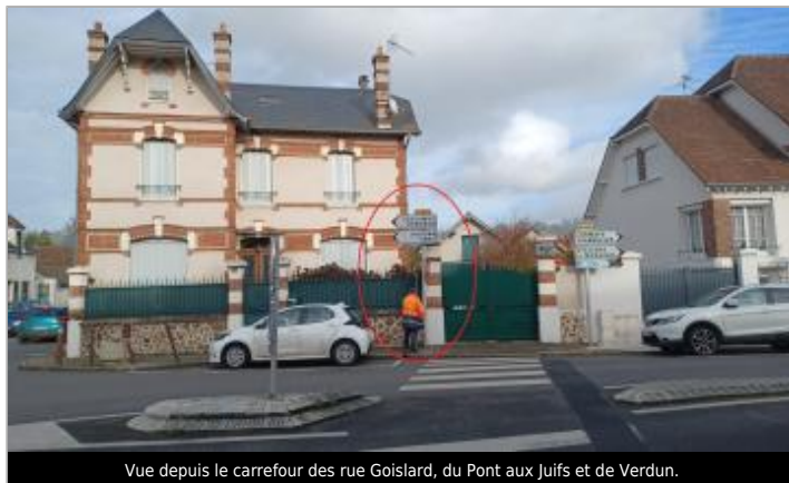
Vue depuis le carrefour des rue Goislard, du Pont aux Juifs et de Verdun.