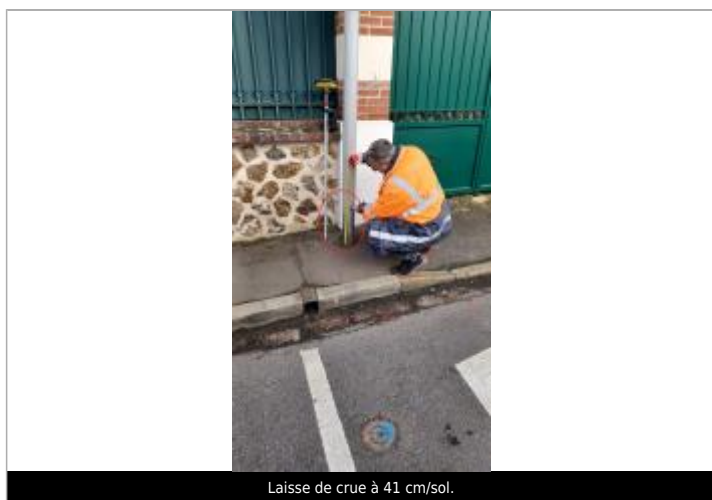
Laisse de crue à 41 cm/sol.