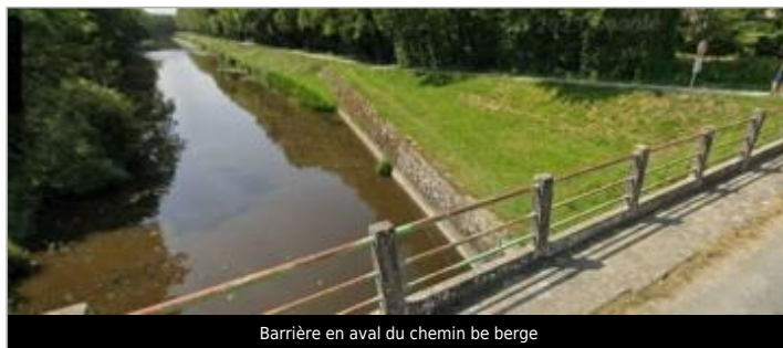
Barrière en aval du chemin de berge

Coordonnées WGS84 : X: -2.02158732 / Y: 47.56629820