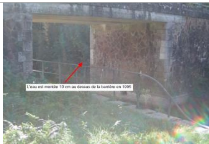
Barrière du chemin en aval du cours d'eau

Type de repérage : Campagne de terrain post-inondation