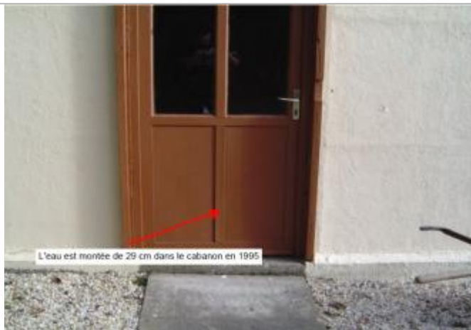
Porte de l'habitation

Type de repérage : Campagne de terrain post-inondation