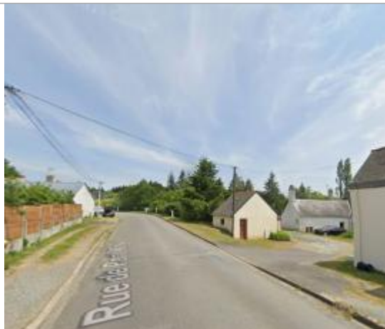
Accès à l'habitation

Coordonnées WGS84 : X: -2.04480741 / Y: 47.57207590