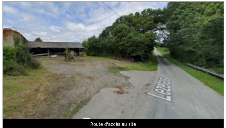
Route d'accès au site

GÉOLOCALISATION Coordonnées WGS84 : X: -1.79044430 / Y: 47.70234780 Coordonnées RGF93 (Lambert 93) X: 340944.54 / Y: 6744445.71 Coordonnées RGF93 (ETRS89) : X: -1.7904443 / Y: 47.7023478 Code Hydro: J78-0300 Rive de référence: Droite