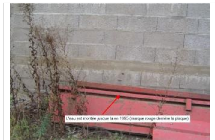
L'eau est montée jusque là en 1995 (marque rouge derrière la plaque)

MARQUE Maximum de l'inondation : Oui Visibilité : Non renseigné État du repère : Non renseigné Pérennité : Non renseigné