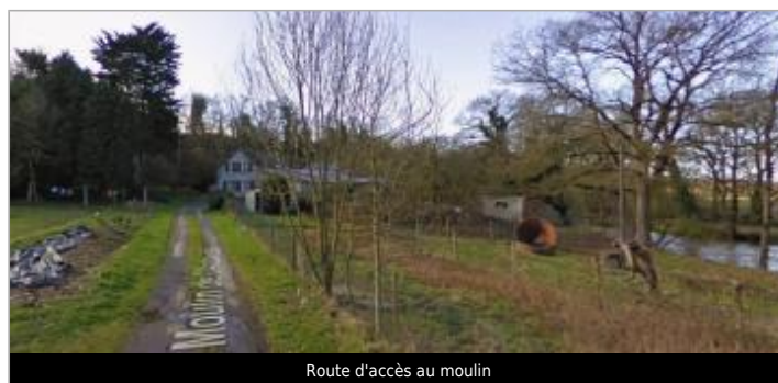
Route d'accès au moulin