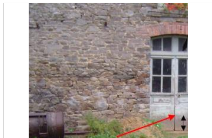
Porte du moulin de l'Ardouais