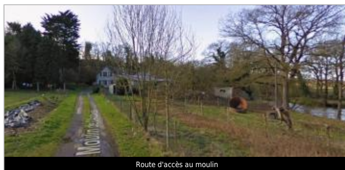
Route d'accès au moulin