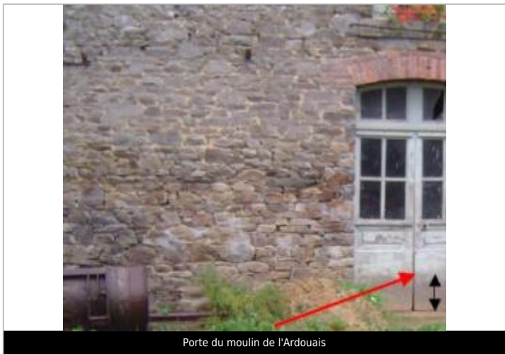
Porte du moulin de l'Ardouais