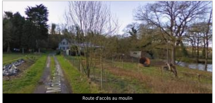
Route d'accès au moulin