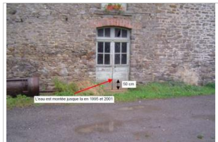
Porte du moulin de l'Ardouais