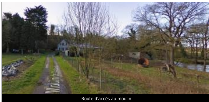
Route d'accès au moulin