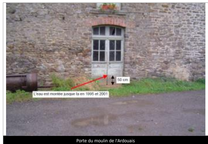
Porte du moulin de l'Ardouais