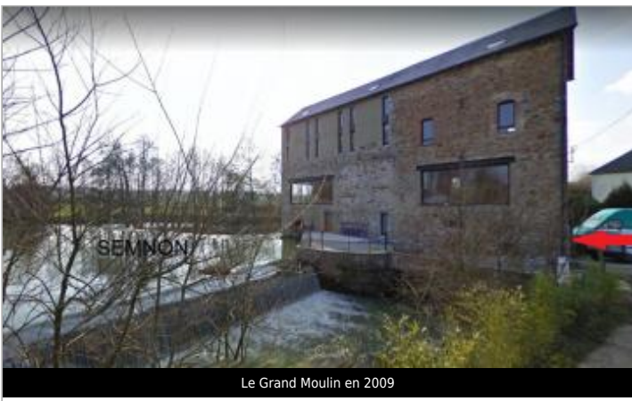
Le Grand Moulin en 2009

GÉOLOCALISATION Coordonnées WGS84 : X: -1.73916730 / Y: 47.90598390 Coordonnées RGF93 (Lambert 93) X: 346140.38 / Y: 6766798.88 Coordonnées RGF93 (ETRS89) : X: -1.7391673 / Y: 47.9059839 Code Hydro: J76-0300 Rive de référence: Droite