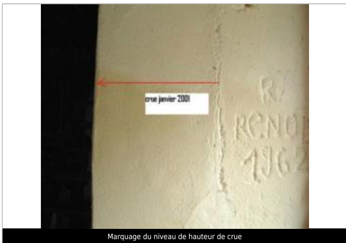
Marquage du niveau de hauteur de crue

Type de repérage : Campagne de terrain post-inondation