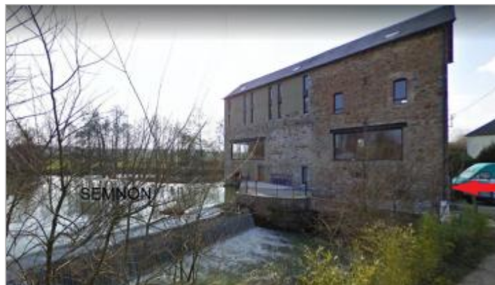
Le Grand Moulin en 2009