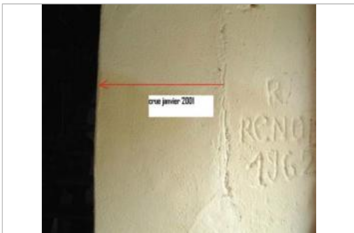
Vue de la trace d'humidité dans la cave du Moulin

Type de repérage : Campagne de terrain post-inondation