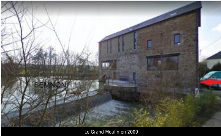
Le Grand Moulin en 2009

GÉOLOCALISATION Coordonnées WGS84 : X: -1.73916730 / Y: 47.90598390 Coordonnées RGF93 (Lambert 93) X: 346140.38 / Y: 6766798.88 Coordonnées RGF93 (ETRS89) : X: -1.7391673 / Y: 47.9059839 Code Hydro: J76-0300 Rive de référence: Droite