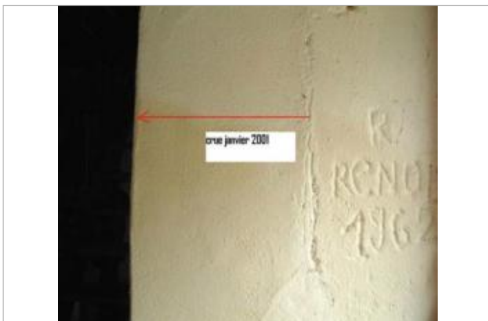
Vue de la trace d'humidité dans la cave du Moulin

Type de repérage : Campagne de terrain post-inondation