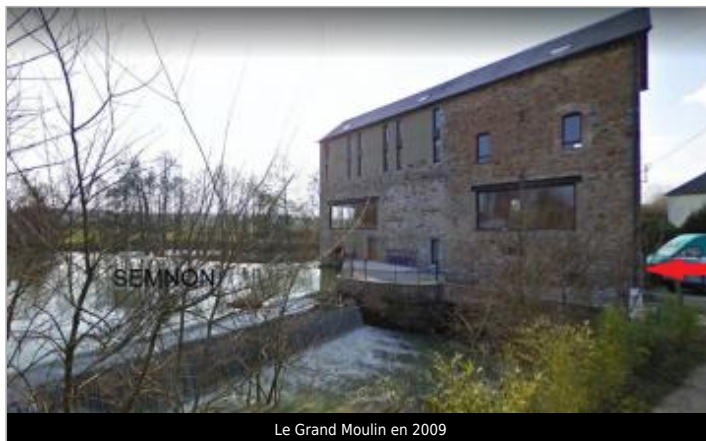
Le Grand Moulin en 2009