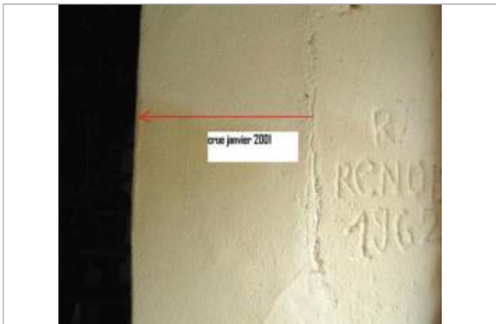
Vue de la trace d'humidité dans la cave du Moulin

MARQUE Maximum de l'inondation : Oui Visibilité : Non renseigné État du repère : Non renseigné Pérennité : Non renseigné