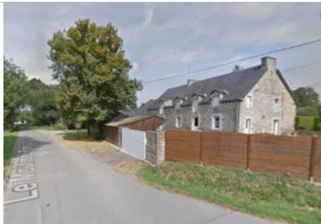
Accès à l'habitation du moulin du pont