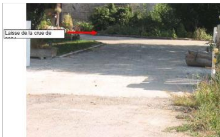
Emplacement du muret repère de crue

Type de repérage : Campagne de terrain post-inondation