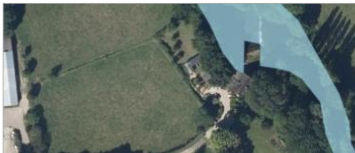
Vue aérienne du moulin de Jégu