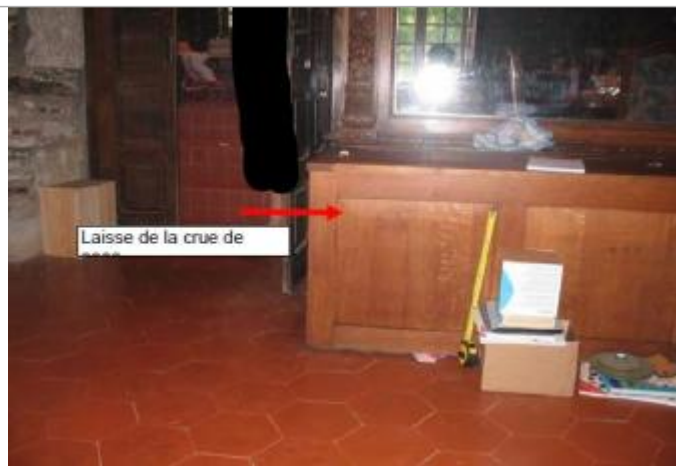
Vue intérieur du moulin

Type de repérage : Campagne de terrain post-inondation