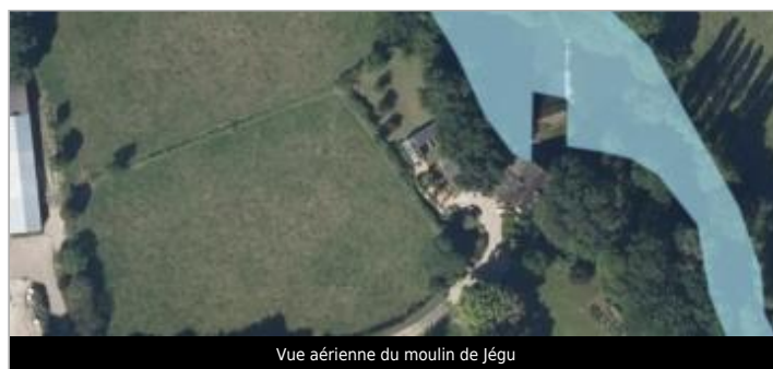
Vue aérienne du moulin de Jégou