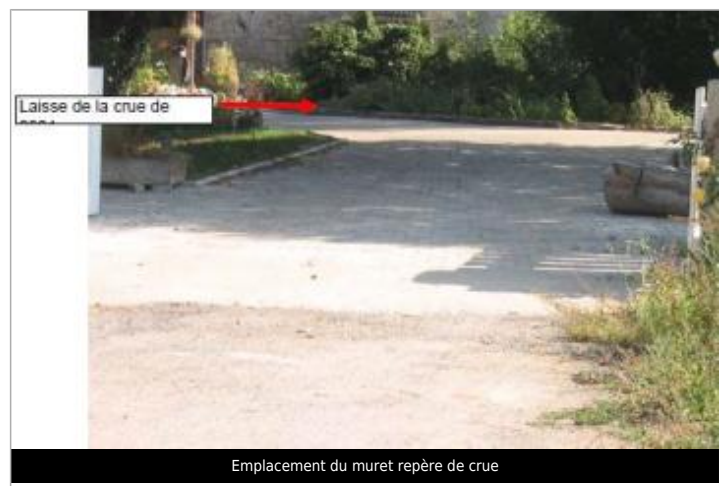
Emplacement du muret repère de crue