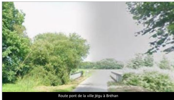
Route pont de la ville Jégu à Bréhan

GÉOLOCALISATION Coordonnées WGS84 : X: -2.67316184 / Y: 48.06301390 Coordonnées RGF93 (Lambert 93) X: 277764.49 / Y: 6788800.63 Coordonnées RGF93 (ETRS89) : X: -2.6731618 / Y: 48.0630139 Code Hydro: J81-0300 Rive de référence: Gauche