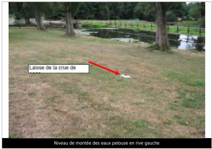
Niveau de montée des eaux pelouse en rive gauche

MARQUE Maximum de l'inondation : Oui Visibilité : Non État du repère : Disparu Pérennité : Non renseigné