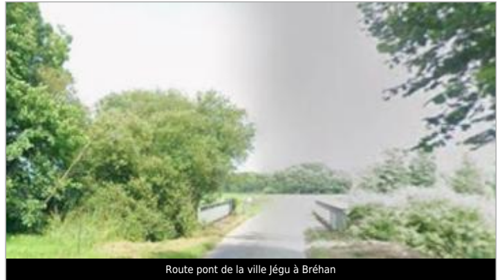
Route pont de la ville Jégu à Bréhan