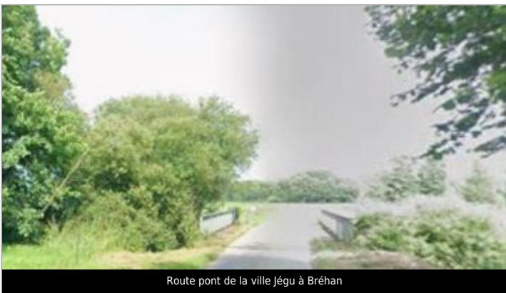
Route pont de la ville Jégu à Bréhan

GÉOLOCALISATION Coordonnées WGS84 : X: -2.67316184 / Y: 48.06301390 Coordonnées RGF93 (Lambert 93) X: 277764.49 / Y: 6788800.63 Coordonnées RGF93 (ETRS89) : X: -2.6731618 / Y: 48.0630139 Code Hydro: J81-0300 Rive de référence: Gauche