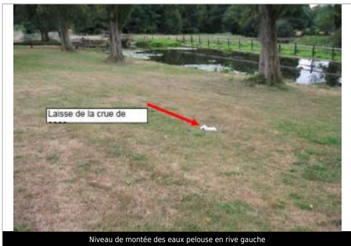
Niveau de montée des eaux pelouse en rive gauche