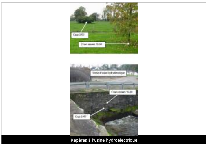
Repères à l'usine hydroélectrique

MARQUE Maximum de l'inondation : Oui Visibilité : Non État du repère : Non renseigné Pérennité : Non renseigné