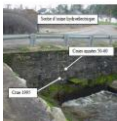
Repères à l'usine hydroélectrique