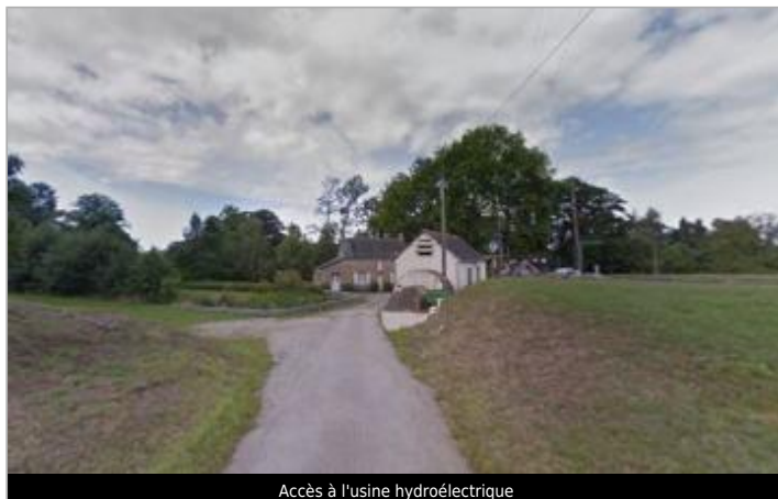
Accès à l'usine hydroélectrique