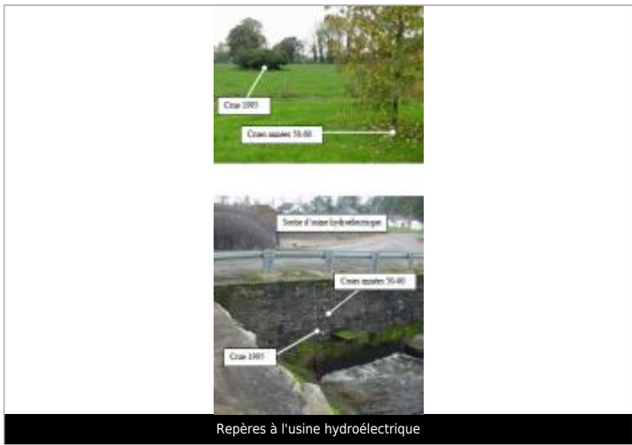
Repères à l'usine hydroélectrique