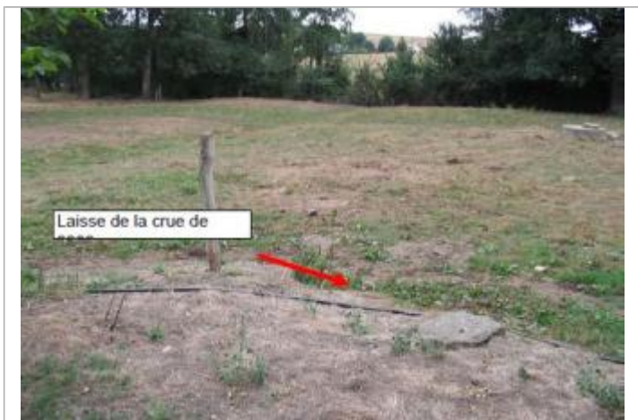
Terrain inondé au pied du talus