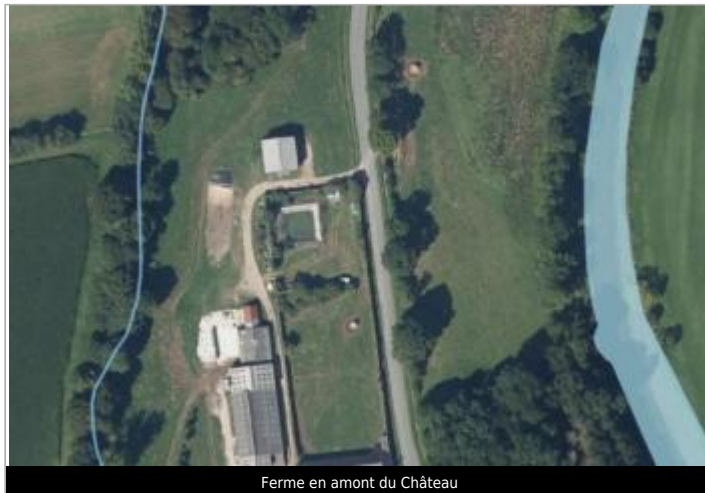
Ferme en amont du Château