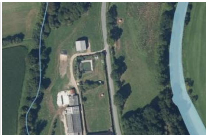
Vue aérienne de la ferme aux Forges

Type de repérage : Campagne de terrain post-inondation