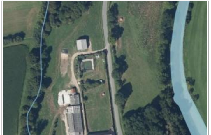
Ferme en amont du Château