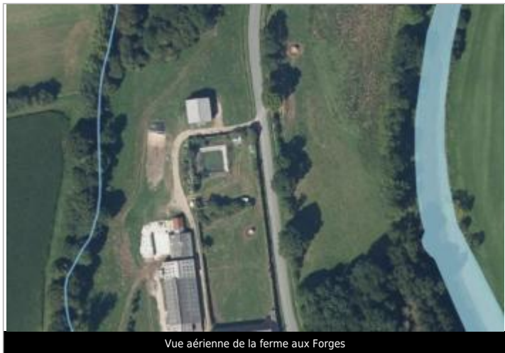
Vue aérienne de la ferme aux Forges