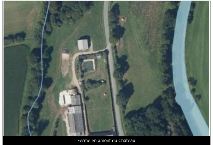
Ferme en amont du Château