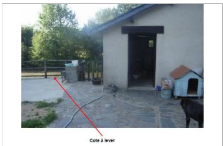
Terrasse au moulin de l'Hopital Beson

GÉNÉRAL Code : RC_Nin_017_2001 Date de mise à jour : 19/12/2025 Auteur : SPC VCB