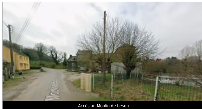
Accès au Moulin de beson

GÉOLOCALISATION Coordonnées WGS84 : X: -2.43097163 / Y: 47.91292380 Coordonnées RGF93 (Lambert 93) X: 294614.67 / Y: 6770894.39 Coordonnées RGF93 (ETRS89) : X: -2.4309716 / Y: 47.9129238 Code Hydro : J83-0300 Rive de référence : Droite