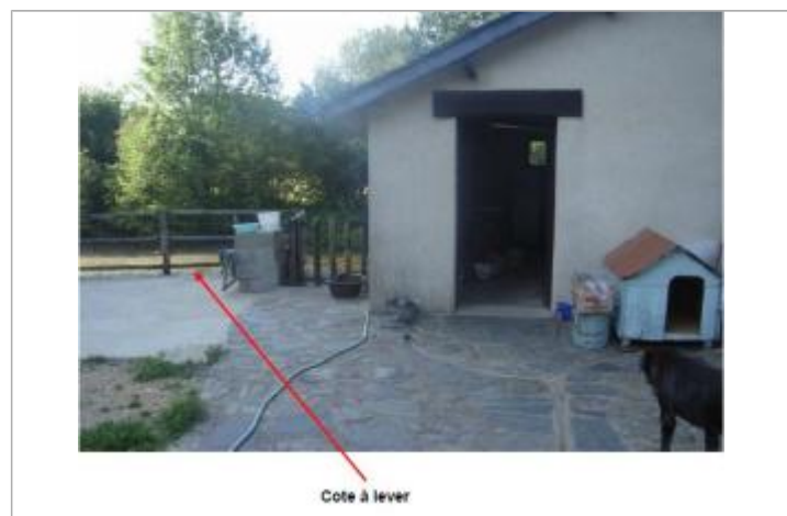
Terrasse au moulin de l'Hopital Beson

MARQUE Maximum de l'inondation : Oui Visibilité : Non État du repère : Non renseigné Pérennité : Non renseigné