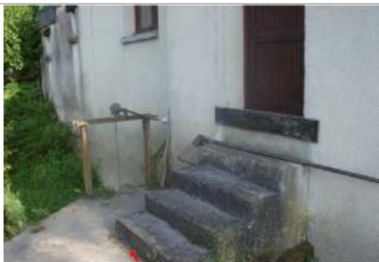
Cote à lever

Type de repérage : Campagne de terrain post-inondation