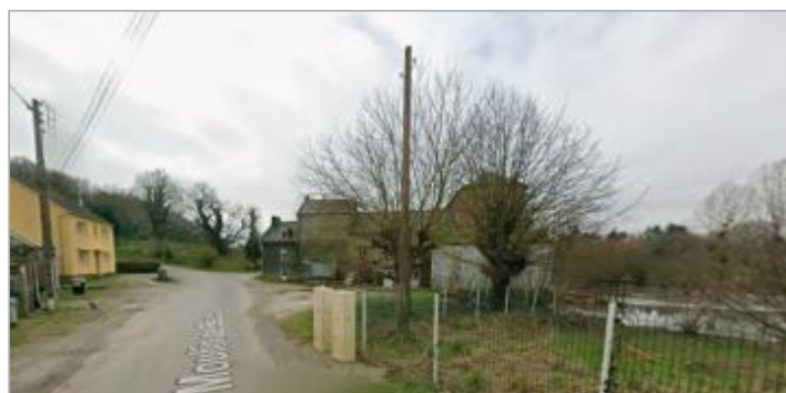
Accès au Moulin de beson

GÉOLOCALISATION Coordonnées WGS84 : X: -2.43097163 / Y: 47.91292380 Coordonnées RGF93 (Lambert 93) X: 294614.67 / Y: 6770894.39 Coordonnées RGF93 (ETRS89) : X: -2.4309716 / Y: 47.9129238 Code Hydro : J83-0300 Rive de référence : Droite