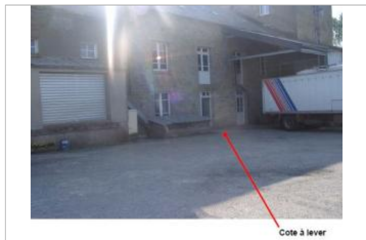
Terrain naturel devant le moulin

MARQUE Maximum de l'inondation : Oui Visibilité : Non renseigné État du repère : Non renseigné Pérennité : Non renseigné