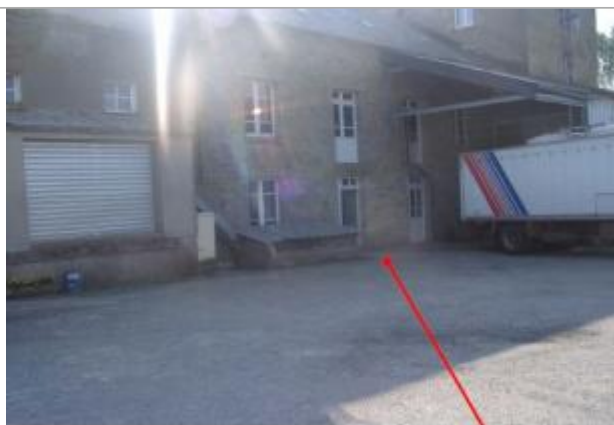
Cote à lever

Type de repérage : Campagne de terrain post-inondation