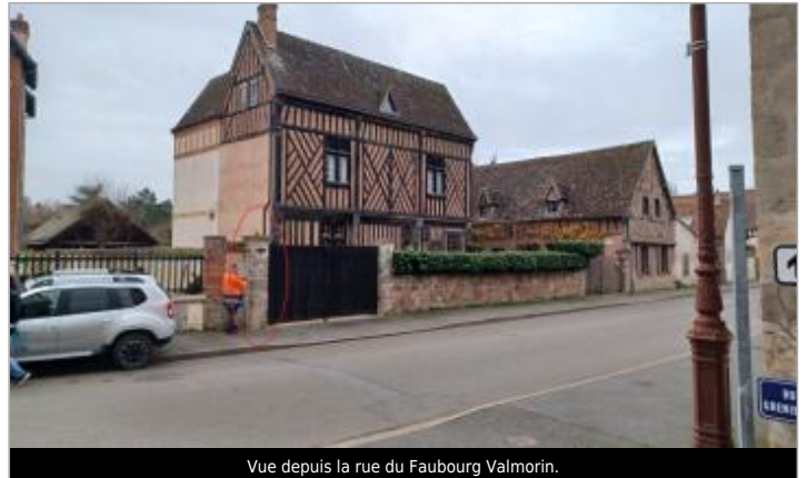
Vue depuis la rue du Faubourg Valmorin.

Coordonnées WGS84 : X: 1.52402628 / Y: 48.65188890