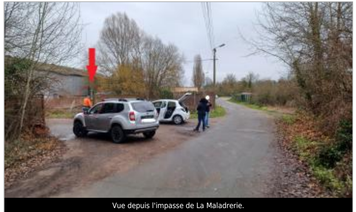
Vue depuis l'impasse de La Maladrerie.

Coordonnées WGS84 : X: 1.52116795 / Y: 48.65130380