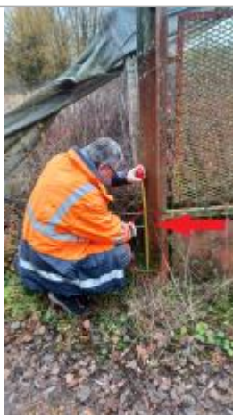
Laisse de crue à 40 cm/sol

Système altimétrique : NGF IGN 1969 (système normal)