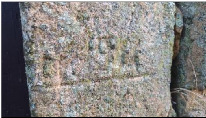
photo du repere