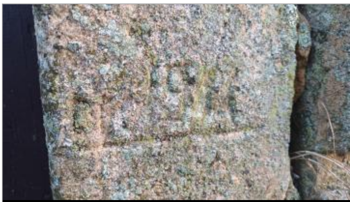
photo du repere

MARQUE Texte : XXX1944 Maximum de l'inondation : Oui Visibilité : Oui État du repère : Mauvais Pérennité : Moyenne