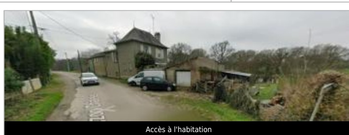
Accès à l'habitation

GÉOLOCALISATION Coordonnées WGS84 : X: -2.43166879 / Y: 47.91541330 Coordonnées RGF93 (Lambert 93) X: 294581.72 / Y: 6771173.94 Coordonnées RGF93 (ETRS89) : X: -2.4316688 / Y: 47.9154133 Code Hydro: J83-0300 Rive de référence: Gauche