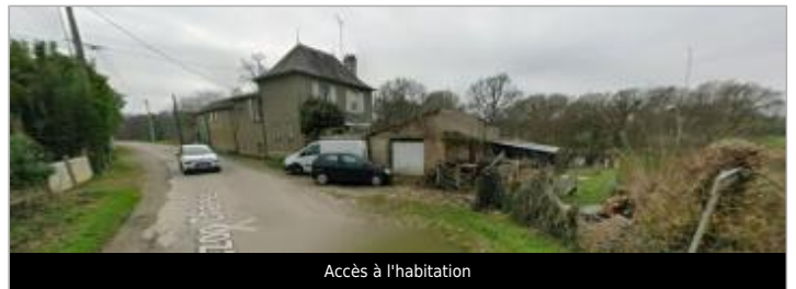
Accès à l'habitation

GÉOLOCALISATION Coordonnées WGS84 : X: -2.43166879 / Y: 47.91541330 Coordonnées RGF93 (Lambert 93) X: 294581.72 / Y: 6771173.94 Coordonnées RGF93 (ETRS89) : X: -2.4316688 / Y: 47.9154133 Code Hydro: J83-0300 Rive de référence: Gauche