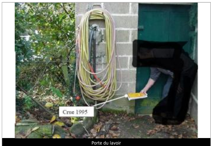
Porte du lavoir

GÉNÉRAL Code : RC_Nin_013_1995 Date de mise à jour : 17/12/2025 Auteur : SPC VCB