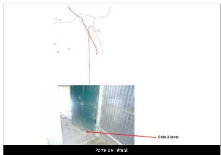
Porte de l'établi

MARQUE Maximum de l'inondation : Oui Visibilité : Non renseigné État du repère : Non renseigné Pérennité : Non renseigné