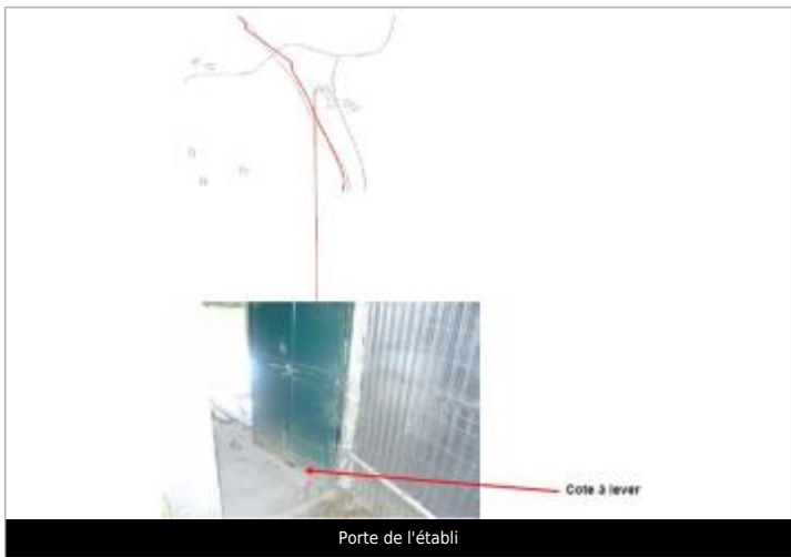
Porte de l'établi

MARQUE Maximum de l'inondation : Oui Visibilité : Non renseigné État du repère : Non renseigné Pérennité : Non renseigné