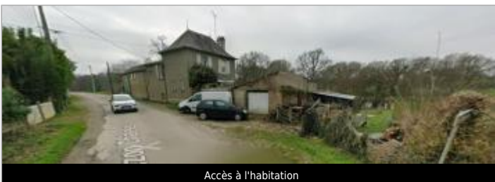
Accès à l'habitation

GÉOLOCALISATION Coordonnées WGS84 : X: -2.43166879 / Y: 47.91541330 Coordonnées RGF93 (Lambert 93) X: 294581.72 / Y: 6771173.94 Coordonnées RGF93 (ETRS89) : X: -2.4316688 / Y: 47.9154133 Code Hydro: J83-0300 Rive de référence: Gauche