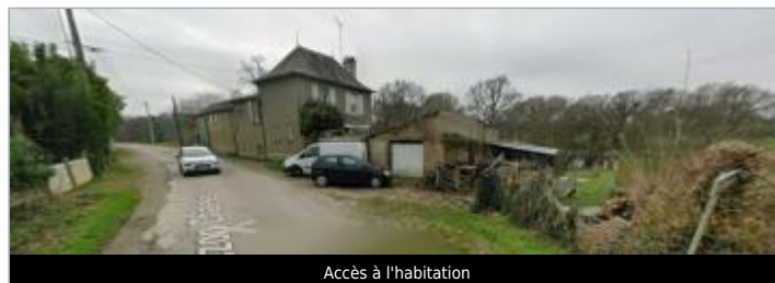
Accès à l'habitation

GÉOLOCALISATION Coordonnées WGS84 : X: -2.43166879 / Y: 47.91541330 Coordonnées RGF93 (Lambert 93) X: 294581.72 / Y: 6771173.94 Coordonnées RGF93 (ETRS89) : X: -2.4316688 / Y: 47.9154133 Code Hydro: J83-0300 Rive de référence: Gauche