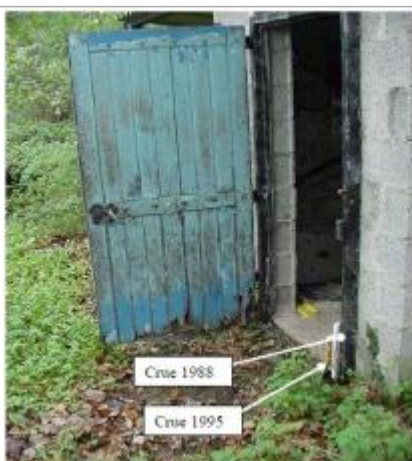
Entrée de la bâtisse

Altitude calculée de l'eau (en m) : 24.67 m