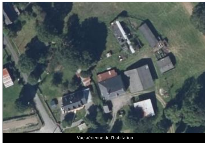
Vue aérienne de l'habitation

GÉOLOCALISATION Coordonnées WGS84 : X: -2.47213444 / Y: 47.97155990 Coordonnées RGF93 (Lambert 93) X: 291998.21 / Y: 6777606.41 Coordonnées RGF93 (ETRS89) : X: -2.4721344 / Y: 47.9715599 Code Hydro: J83-0300 Rive de référence: Droite