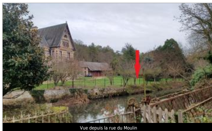
Vue depuis la rue du Moulin