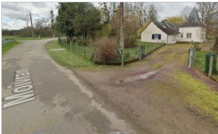
Accès habitation n°16 Moivran