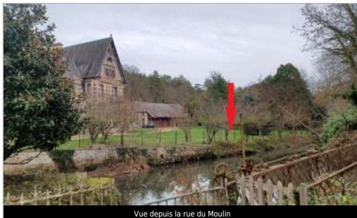
Vue depuis la rue du Moulin