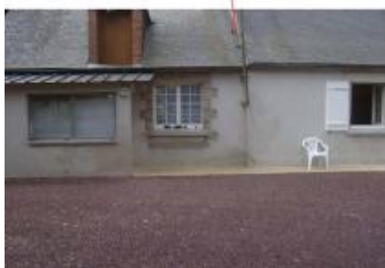
Terrain de l'habitation inondée

Type de repérage : Campagne de terrain post-inondation