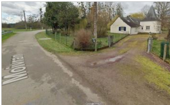
Accès habitation n°16 Moivran