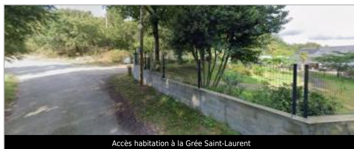
Accès habitation à la Grée Saint-Laurent

GÉOLOCALISATION Coordonnées WGS84 : X: -2.48717821 / Y: 48.00794300 Coordonnées RGF93 (Lambert 93) X: 291159.07 / Y: 6781717.43 Coordonnées RGF93 (ETRS89) : X: -2.4871782 / Y: 48.007943 Code Hydro: J833-3010 Rive de référence: Droite