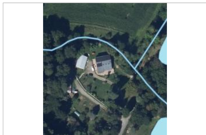
Vue aérienne habitation à la Grée Saint-Laurent

MARQUE Maximum de l'inondation : Oui Visibilité : Non État du repère : Non renseigné Pérennité : Non renseigné