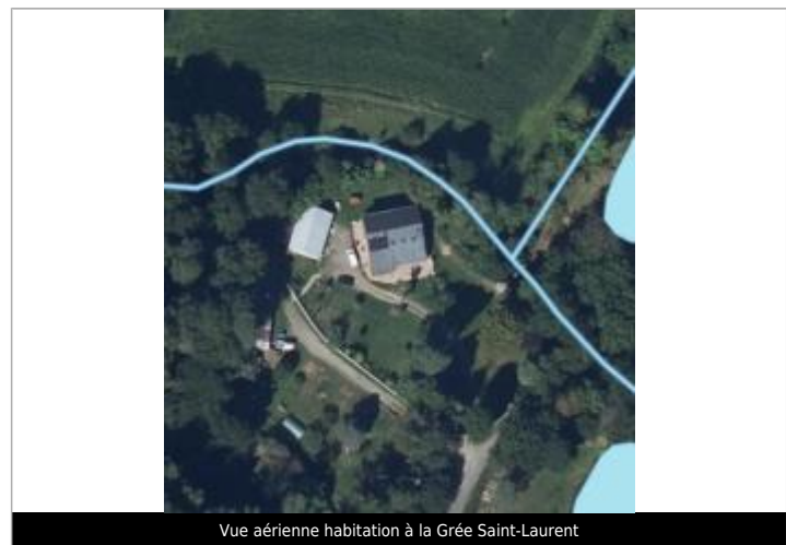
Vue aérienne habitation à la Grée Saint-Laurent