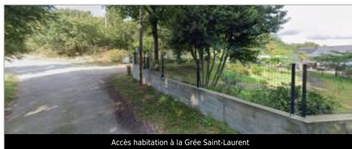
Accès habitation à la Grée Saint-Laurent