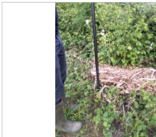
Vue de la laisse - auteur SPC GAD