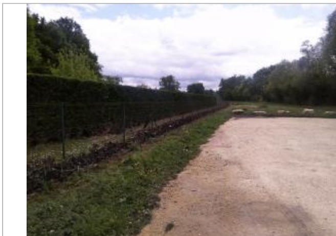
Vue du site - auteur : SPC GAD

Coordonnées WGS84 : X: 0.62228980 / Y: 45.19205370